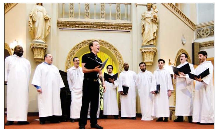
Le groupe Multisons

Oui, les retombées sont non seulement concrètes, mais immédiates. Il suffisait de voir le sourire des personnes hospitalisées lors de la remise des fleurs aux deux pavillons ou le regard ému des usagers présents avec leurs proches à la chapelle pendant la célébration eucharistique où le groupe Multisons a magnifiquement interprété des chants gospels.