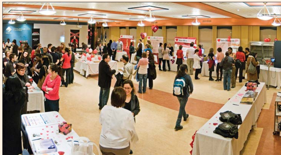
Photo prise lors du dernier 5 à 7 rencontre et recrutement du 24 février dernier à l'auditorium Émilie-Gamelin.