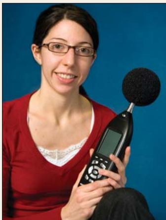
On m'aperçoit ici sur la photo, ayant entre les mains l'appareil de marque Larson Davis avec lequel j'ai effectué les mesures.

Merci à tous ceux qui, de près ou de loin, ont contribué à la réalisation de ce projet!