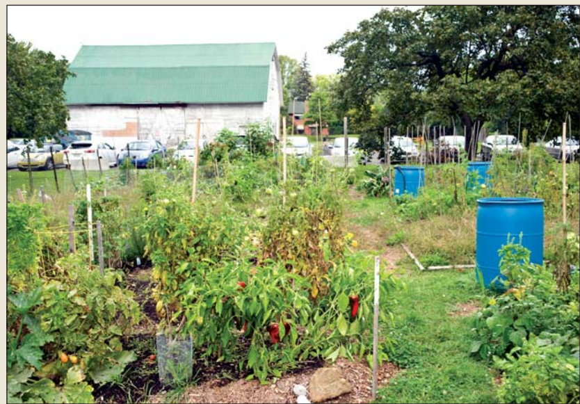
Le jardin des employés de l'HSCM est situé au sud du pavillon principal, près du stationnement C.