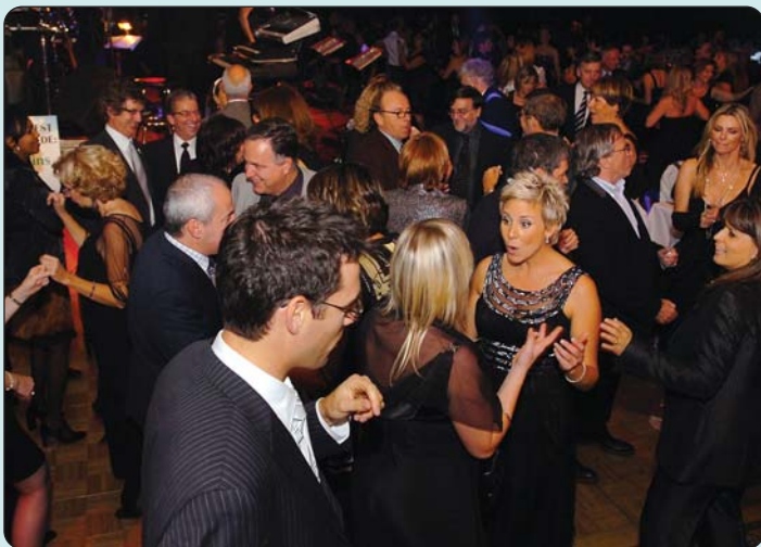
Voici l'ambiance qui régnait, l'année dernière, au gala annuel de la Fondation

C'est le 30 octobre prochain, à 18h30, au Sheraton Laval, qu'aura lieu le 18 e gala de la Fondation que l'on a rebaptisé cette année: Le rendez-vous des Émilie .